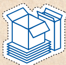
ENVASES PAPEL Y CARTÓN